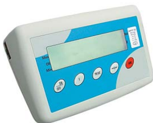
Indicator C31 carcasa plastic ABS grad protectie IP 54 baterii