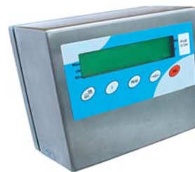
Indicator C31/H carcasa INOX grad protectie IP 67 acumulator 6Vcc/3.4 Ah

Platanul platformelor este confectionat din INOX